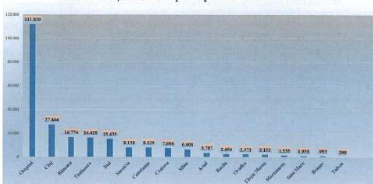
Numărul de mișcări aeronave pe aeroporturile din România în anul 2023